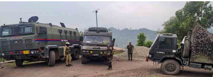
గాలింపు చర్యలు చేపట్టింది. దాంతో ఓ ఉగ్రవాదిని హతం చేశారు. ఎదురు కాల్పులు 5 గంటలపాటు సాగింది. ఉగ్రవాదులు అడివారం రాత్రి సరిహద్దు దాటి అఖ్బార్ వచ్చినట్లు సమాచారం.

శ్రీనగర్: జమ్మూకశ్మీర్ లోని అఖ్బార్ సెక్టార్ లో భారత భద్రతా బలగాలు ఓ ఉగ్రవాదిని హతం చేశారు. ఘటనా స్థలంలో ఉగ్రవాది మృత దేహంతో పాటు ఓ ఆయుధం స్వాధీనం చేసుకున్నారు. అధికారల కథనం ప్రకారం, టెర్రరిస్టులు సోమవారం ఉదయం 6.30 గంటకు నియంత్రణ రేఖ వద్ద ఆర్మీ క్యాంపును పై కాల్పులు జరిపారు. ఈ దాడిలో వాహనం కాస్త దెబ్బతింది. జవాసందరూ సురక్షితంగా ఉన్నారు. టెర్రరిస్టులు తర్వాత అడవిలోకి పారిపోయారు. దాంతో సైన్ భారీగా బలగాలను మోహరించి