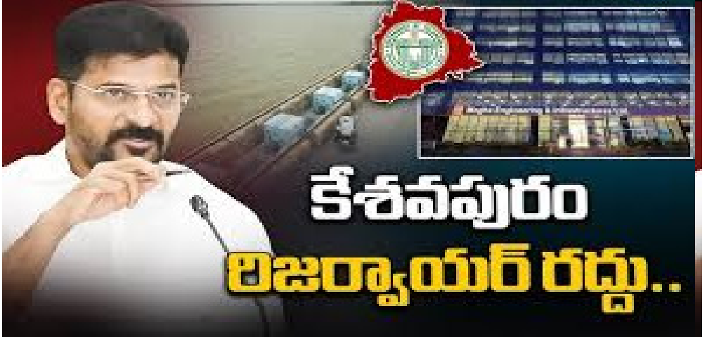
కేశవపురం రిజర్వాయర్ రద్దు..

సవరించిన ప్రణాళిక ప్రకారం.. మల్లన్నసాగర్ నుంచి 15 టీఎంసీల నీటిని పంపింగ్ చేయాలని ప్రభుత్వం భావిస్తోంది. అందులో హైదరాబాద్ కు 10 టీఎంసీలు వాడుకోనుండగా.. జంట జలాశయాలు 5 టీఎంసీలు మల్లించాలని నిర్ణయించినట్లు సమాచారం. అయితే.. ఈ ప్రాజెక్టుకు కేబినెట్ కూడా ఆమోదం తెలపగా.. త్వరలోనే టెండర్లు